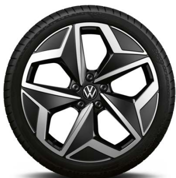
Di serie su Tour

... include bulloni ruote con sistema antifurto