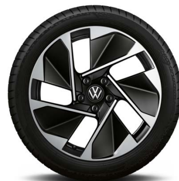
Cerchi in lega EAST DERRY 7,5J x 18" con pneumatici 215/55 R18 95T superficie diamantata

... solo in combinazione con pacchetti WM1 o WM2