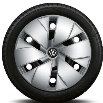
Di serie su Life, Business, Style, Family, Tech, Max

Cerchi in acciaio 7,5J x 18" con pneumatici 215/55 R18 95T