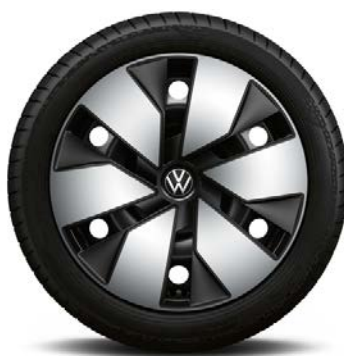
Di serie con Bi-color Exterior Style Pack

Cerchi in acciaio 7,5J x 18" con pneumatici 215/55 R18 95T