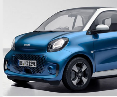
smart EQ fortwo passion

pure. Nell'equipaggiamento standard, una smart ha già tutto ciò che la rende smart: idee, intelligenza e design.