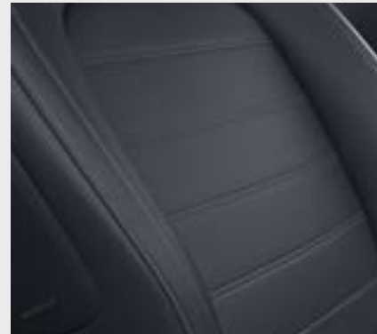
plancia e pannelli centrali delle porte in tessuto nero e rivestimento in nero (61U)