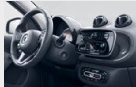
plancia carbon-look 1 (H02)