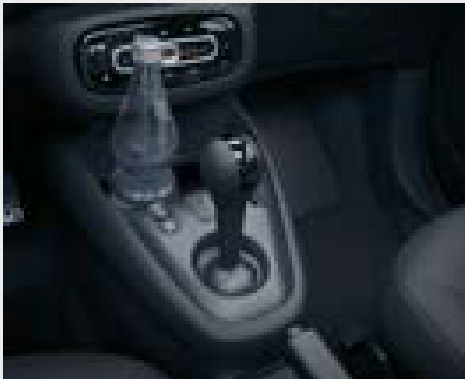
Console centrale con copertura e bracciolo centrale nella parte anteriore (pieghevole) (J59)

La passion (DL3) distingue la tua smart, esteticamente e tecnologicamente. I tessuti a rete e il nuovo design della seduta, insieme alle doppie cuciture conferiscono agli interni un aspetto di valore.