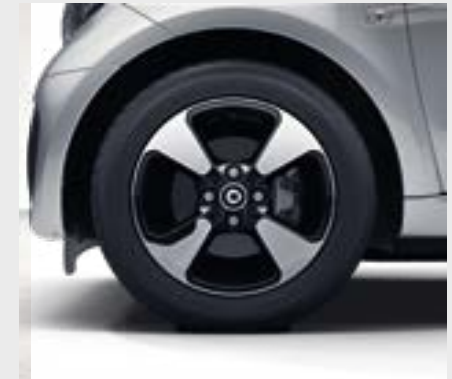
Cerchi in lega leggera da 38,1 cm (15") a 4 razze, verniciati in black e torniti con finitura a specchio [R32]