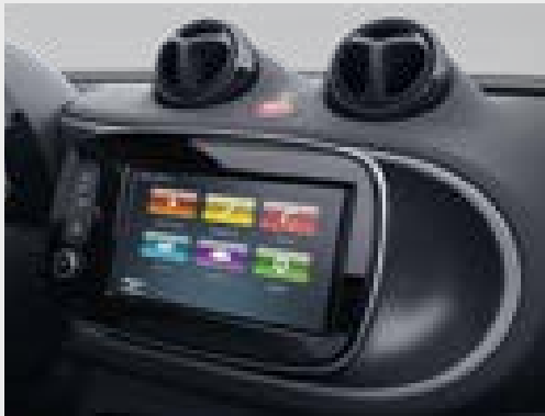
smart Media-System (535)

la pulse (DL7) , sintesi di sportività per la tua smart: cerchi in lega da 16", verniciati in black con una finitura lucida, il volante sportivo multifunzione in pelle e i pedali sportivi in acciaio e ne sottolineano il carattere dinamico.