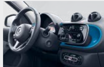
plancia blue a nido d'ape 1 (H04)