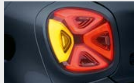
fari full LED posteriori (K32)