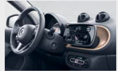
plancia gold beige 1 (H03)