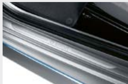
battitacco non illuminati, set di 2