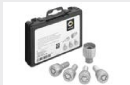
smart rim locks