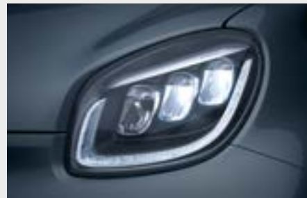
fari full LED anteriori (K32)