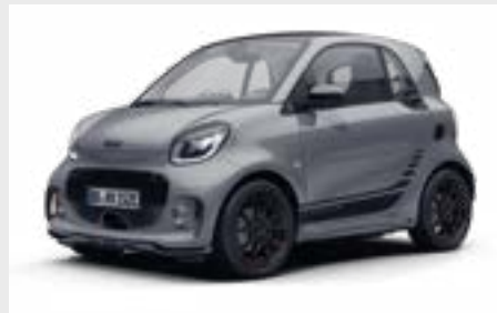
smart EQ fortwo edition one