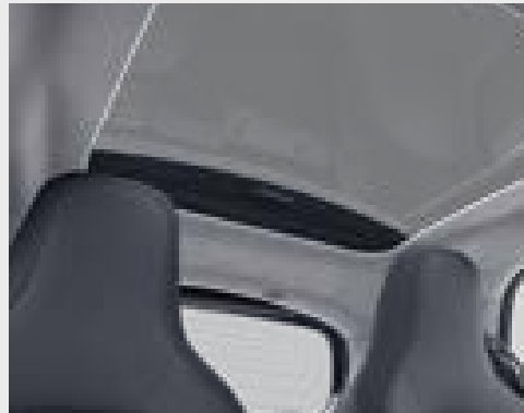
Tetto panorama E22)