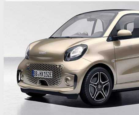
smart EQ fortwo pulse

passion. Ogni smart è qualcosa di speciale. E se ti piace ancora più ricca, la passion è quella perfetta per te.