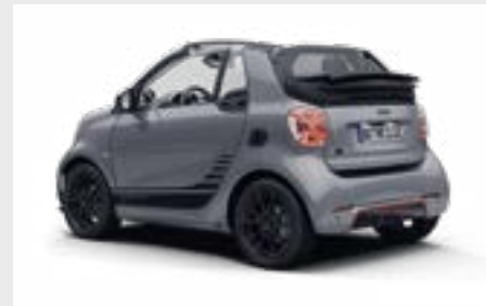
smart EQ fortwo cabrio edition one