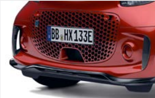
spolier anteriore (fortwo/cabrio)