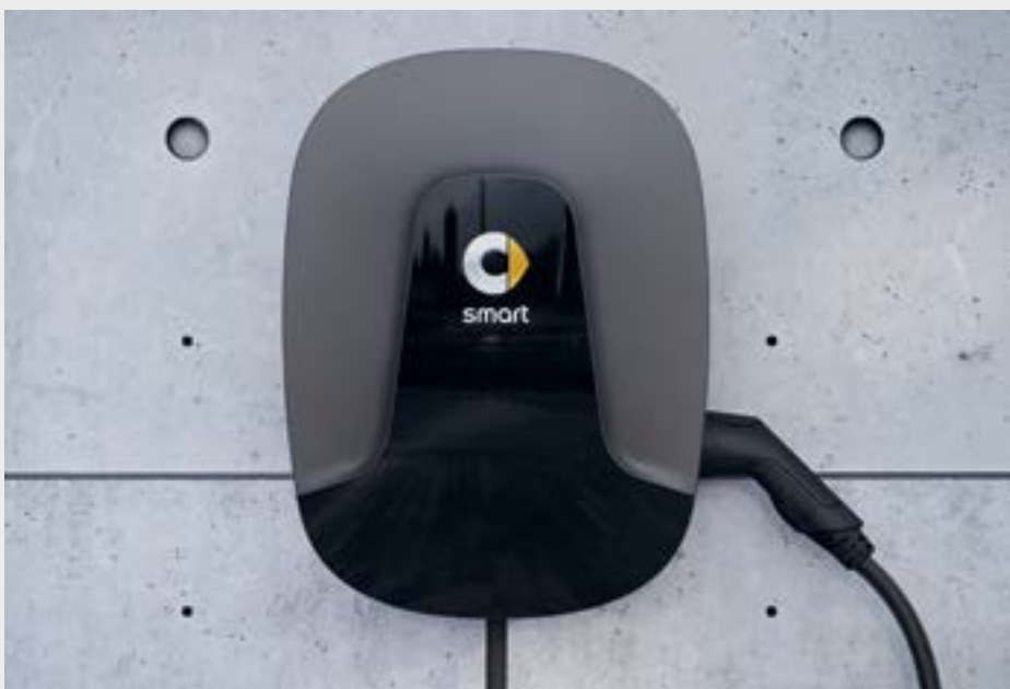
Wallbox con cavo di ricarica integrato