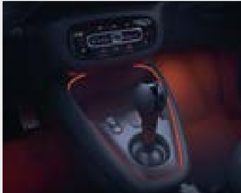
Luci ambient (877)

La prime (DL5) evidenzia l'eleganza della tua smart grazie ai nuovi cerchi in lega da 16", sedili in pelle e i nuovi fari Full-LED.