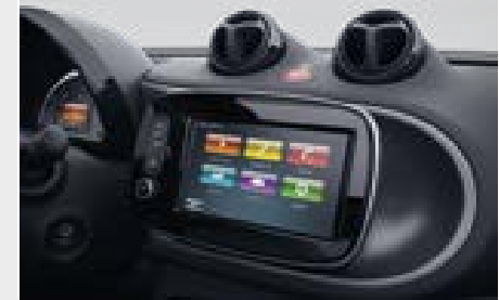
smart Media-System (535)