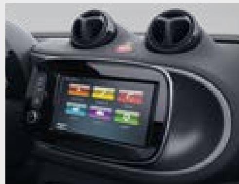
smart Media-System (535)