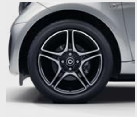
> Cerchi in lega da 40,6 cm (16") a 5 razze verniciati in nero e torniti con finitura a specchio (R91)