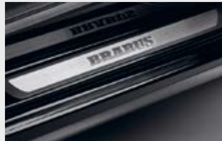
Soglie d'ingresso BRABUS,