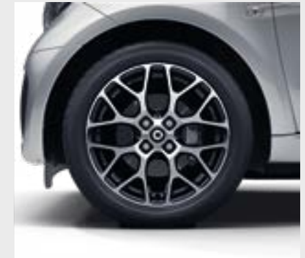
Cerchi in lega leggera da 40,6 cm (16") a 8 razze a Y, verniciati in nero con finitura a specchio