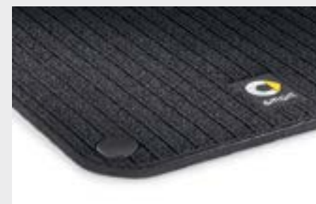
Tappetini in reps, neri