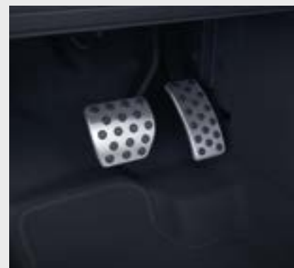
Pedali sportivi in acciaio inossidabile spazzolato con finiture in gomma