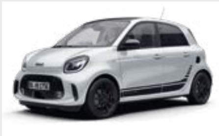
smart EQ forfour edition one