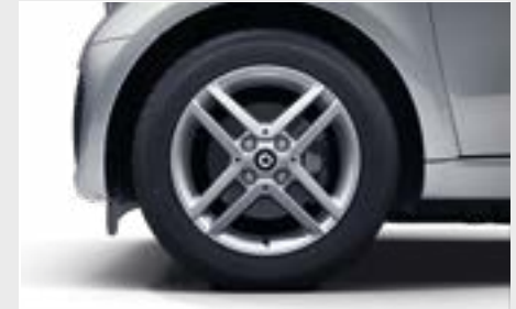
> Cerchi in lega leggera da 15" a 4 doppie razze (R35)