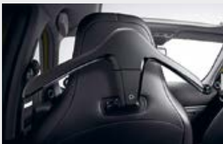
appendi abiti, nero