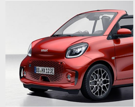
smart EQ fortwo prime

pulse. L'impulso sportivo parte con la pulse: cerchi in lega leggera da 40,6 cm (16") ed equipaggiamenti sportivi.