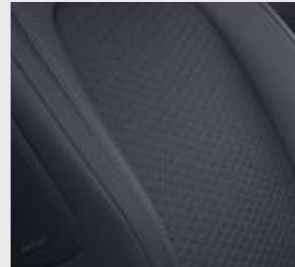
Plancia e pannello centrale delle porte in tessuto nero e rivestimento in nero / grigio (54U)