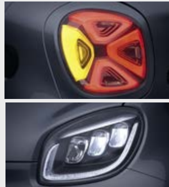
Fari Full LED (K32)