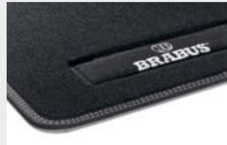
tappetini in velluto BRABUS