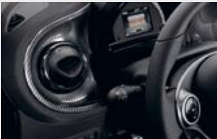
Elementi decorativi BRABUS in carbon-look