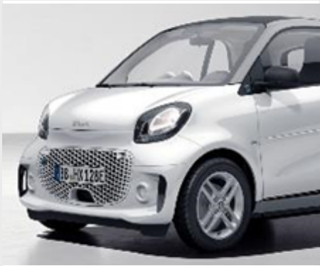
smart EQ fortwo pure

pure. Nell'equipaggiamento standard, una smart ha già tutto ciò che la rende smart: idee, intelligenza e design.