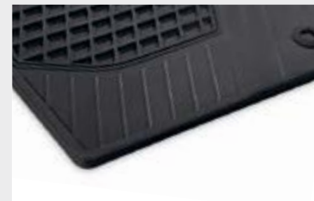
Tappetini in gomma, neri