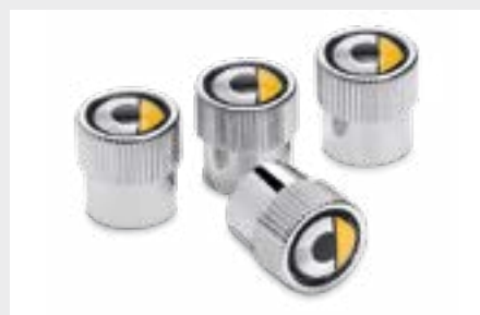
Cappucci coprivalvola, set da 4