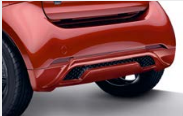
Grembialatura posteriore BRABUS