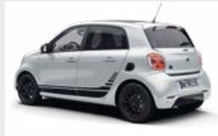
smart EQ forfour edition one