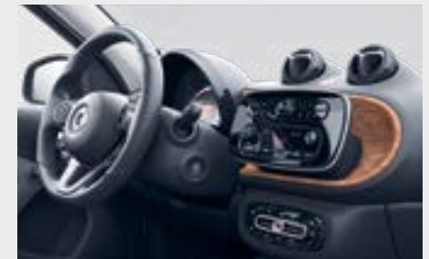
plancia wood look 1 (H05)